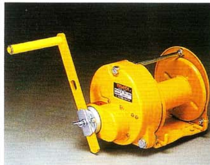
GM-3-S I型 ストッパー内蔵式 300kgf用