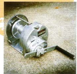
GM-3-GS S I型 ストッパー内蔵式 300kgf用 メッキ仕上げ

錆びにくく、保守管理が簡単な、溶融亜鉛メッキ加工仕上げウインチに変更可能です。ご注文時に、販売店までお申し付け下さい。